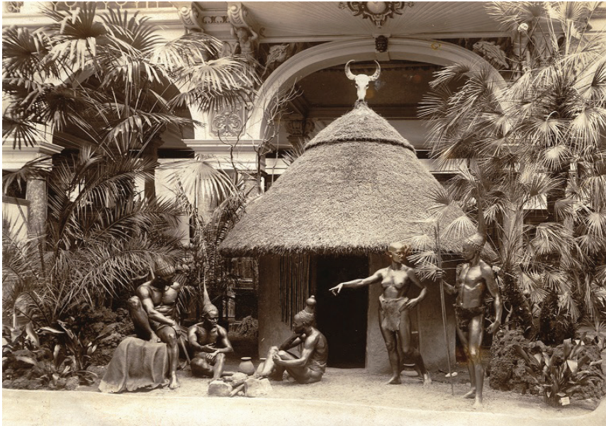
Figura 3: “Grupo de amostra” dos Xonas no primeiro pátio do museu. Arquivo de imagens históricas do Übersee-Museum.

Fonte: HISTORISCHES BILDARCHIV ÜBERSEE-MUSEUM, Bremen. [sem título], [19--]. n. P20535.