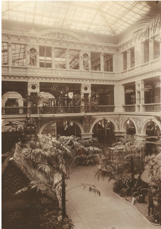
Figura 2: O pátio interior do “Museu Municipal”, cerca de 1900. Arquivo de imagens históricas do Übersee-Museum.

Fonte: HISTORISCHES BILDARCHIV ÜBERSEE-MUSEUM, Bremen. Erster Lichthof , [19--]. n. P20537.