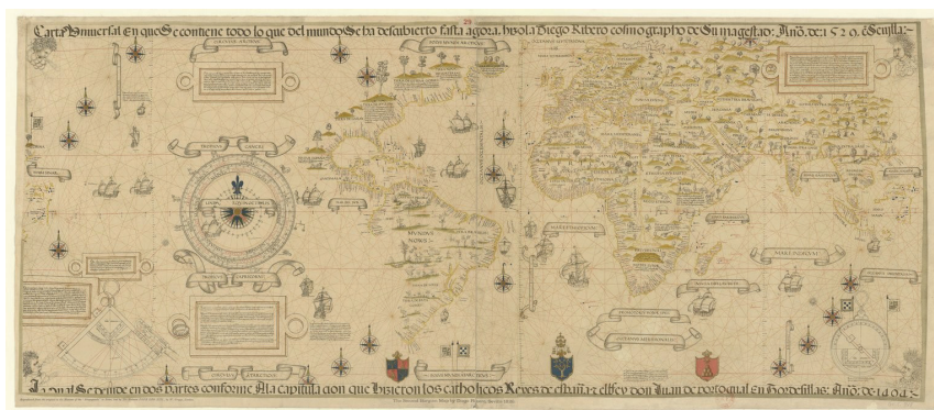
Figura 2: Carta universal en que contiene todo lo que del mundo se ha descubierto fasta agora (1529)