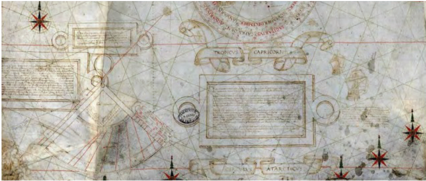
Figura 4: Detalle del mapa de Diego Ribeiro