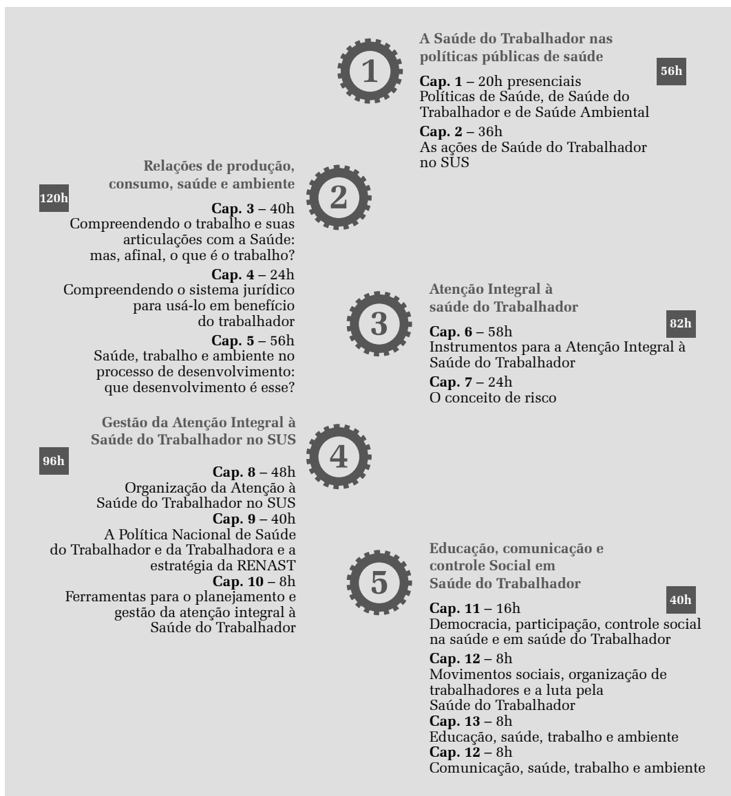
Figura 1 Estrutura do Cest-AD organizada pelas unidades de aprendizagem e eixos temáticos, 2016