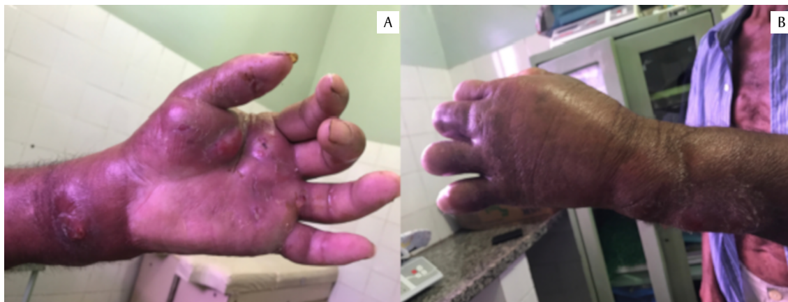
Figura 2 Membro afetado do pescador, ao procurar atendimento médico pela segunda vez, pouco antes da intervenção cirúrgica. A) Vista dorsal da mão esquerda. B) Vista ventral da mão esquerda

Foram observadas sequelas mesmo após a recuperação completa do quadro infeccioso. Dentre elas, a mão em garra e a atrofia muscular com perda parcial dos movimentos e da sensibilidade do membro, incapacitando-o definitivamente para o exercício das atividades profissionais ( Figura 3 ).