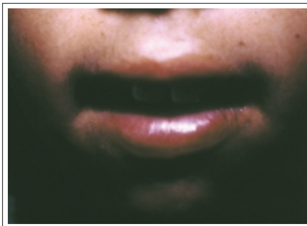
Figura 4: Alterações da arcada dentária do paciente respirador bucal associado a alterações actínica labiais. / Figure 4: Alterations of the dental arch of the mouth-breather patient associated with actinic lip alterations.

The patient is being followed-up at the outpatient dermatology clinic, which allows him to take advantage of lip photoprotectors. The two conditions of allergic rhinitis and chronic oral breathing are being treated in conjunction with the allergy and pediatry clinic.