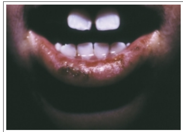
Figura 2: Queilite de lábios inferiores com eritema, crostas e fissuras. / Figure 2: Cheilitis of the inferior lip with erythema, crusts and fissures.