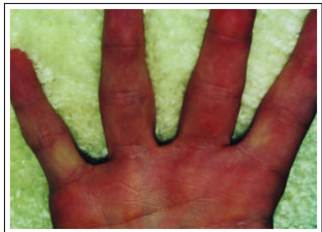
Figura 6: Coxins interfalangeanos sobre paquidermodactilia. Região palmar após tratamento / Figure 6: Interphalangeal pads on pachydermodactyly; palmar region after treatment