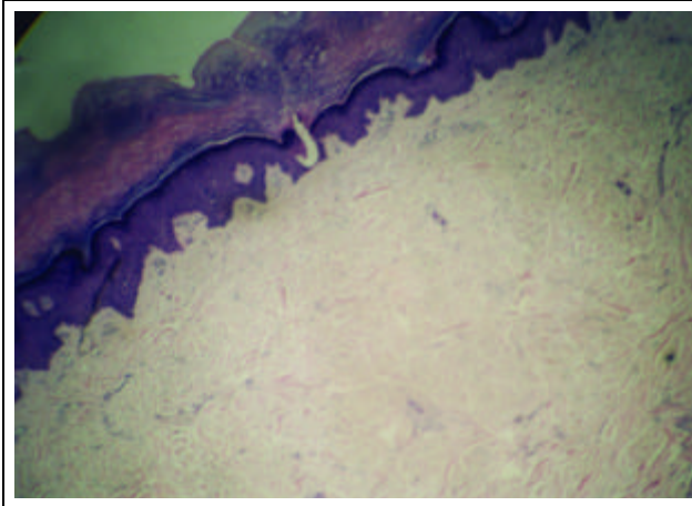
Figure 4: Histology of the interphalangeal pads on pachydermodactyly (hematoxylin & eosin - 100X)

tológico foi de coxim interfalangeano sobre paquidermodactilia. O paciente foi orientado a não mais atritar os dedos e a realizar duas sessões quinzenais de infiltração intralesional de triancinolona na PD e sob o CI, com desaparecimento total das lesões de CI, normalização praticamente total da pele na região do PD (Figuras 5 e 6) e recuperação ampla do movimento dos dedos. Após um mês de observação, não havia indícios de recidiva.