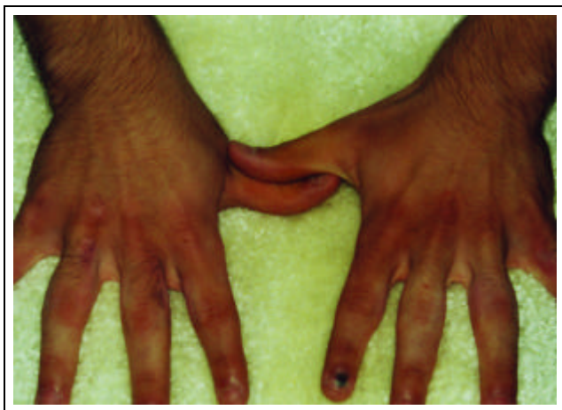
Figura 5: Coxins interfalangeanos sobre paquidermodactilia. Região dorsal após tratamento / Figure 5: Interphalangeal pads on pachydermodactyly; dorsal region after treatment

To date, approximately 335 cases of IP and 50 of PD have been described, demonstrating that they are clinically