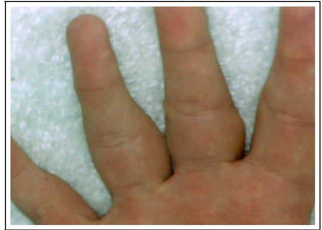
Figura 2: Paquidermodactilia - detalhe da região palmar dos dedos / Figure 2: Pachydermodactyly; detail of the palmar region of the fingers

falange proximal, acometendo do segundo ao quinto dedos de ambas as mãos (Figuras 1 e 2). A alteração era assintomática, porém impossibilitava-o de flexurar totalmente os dedos, o que lhe atrapalhava em algumas atividades do cotidiano. Sobre as articulações metacarpofalangeanas e face lateral da tumefação observavam-se algumas lesões nodulares, com limites precisos, ceratósicas (Figura 3). O próprio paciente admitia que suas lesões eram causadas pelo atrito, pois constantemente cruzava e friccionava os dedos de uma mão contra os da outra. Embora as lesões hiperkeratóticas também fossem assintomáticas, o paciente coçava-as com frequência. Além disso, acusou o controle do videogame como outro fator de atrito. Foi feito exame anatomopatológico de fragmento em fuso, pegando ao mesmo tempo a lesão nodular e a região edemaciada (Figura 4). A epiderme apresentava acantose e hiperqueratose (correspondendo à nodulação). Na derme observavam-se aumento numérico de fibroblastos, proliferação e espessamento das fibras colágenas envolvendo as glândulas sudoríparas écrinas. As fibras de colágeno estavam dissociadas pela presença de mucina. Não havia processo inflamatório. O raio X das mãos não mostrou comprometimento ósseo ou periósteo. O diagnóstico clínico e his-