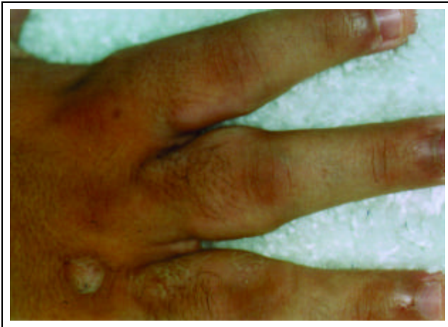
Figura 1: Paquidermodactilia - espessamento cutâneo das regiões falangeanas proximais, do segundo ao quinto dedos / Figure 1: Pachydermodactyly; cutaneous thickening in the proximal phalangeal regions, from the second to fifth fingers