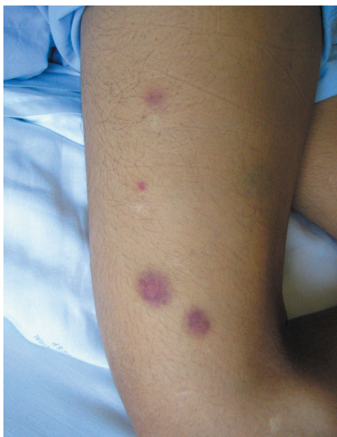
FIGURA 1: Lesões papulonodulares eritemato-violáceas, algumas purpúricas, nos membros inferiores

Em novo mielograma de controle da doença hematológica, realizado em fevereiro de 2007, foi