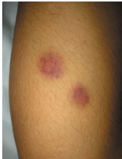
FIGURA 2: Detalhe das lesões eritemato-purpúricas dos membros inferiores