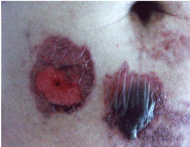
FIGURA 1: Lesões bolhosas e exulceradas em região periumbilical

o diagnóstico dificultado pelo desconhecimento dos profissionais de saúde a respeito da síndrome. 3,4 Neste relato, descreve-se e discute-se um caso raro de uma paciente com dermatite factícia desencadeada pela síndrome de Münchhausen.