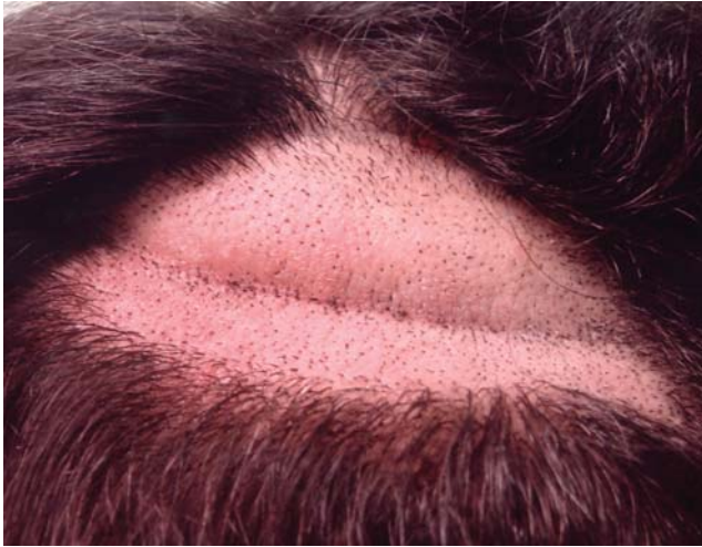
FIGURA 1: Área afetada do vértex tricotomizada mostra aumento de partes moles com pregueamento ou sulco

lhantes. Exames laboratoriais e físico não mostraram outras alterações (hemograma completo, provas de função hepática, renal, ASO, FAN, VDRL, IgE total, glicemia de jejum, perfil lipídico e hormônios de tireoide). O exame anatomopatológico evidenciou capilares ectásicos na derme, infiltrado mononuclear perifolicular e edema discretos, aumento do subcutâneo e ausência de mucina (Figura 2). O estudo com ultrassom mostrou aumento de espessura do subcutâneo, variando de 6,2 mm a 9,1 mm – em indivíduos normais esperam-se entre 5 e 6 mm para a região do vértex (Figura 3).