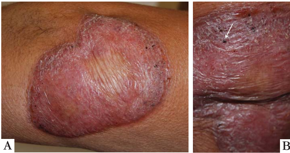
FIGURA 1: A. Lesão eritematoescamosa crostosa no cotovelo esquerdo da doente; B. Detalhe da lesão; a seta indica crosta hemisférica onde, preferencialmente, o material deve ser colhido para exame micológico, obtendo-se o achado mais frequente dos corpos fumagoides

no cotovelo há cerca de dois anos. O exame anatomopatológico estabeleceu o diagnóstico de cromomicose , a qual foi descrita em periódico brasileiro há 90