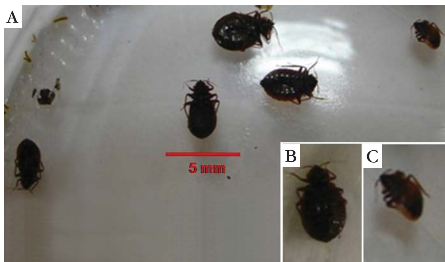
FIGURA 2: A. Vários percevejos-de-cama trazidos pela paciente no pote de vidro. Observar que a forma adulta mede cerca de 5mm de comprimento. B. Detalhe da face ventral do inseto. C. detalhe da face dorsal

Orientou-se a dedetização do apartamento pela possibilidade de cimidiase. Apesar da reação incrível da doente quanto ao diagnóstico, após 3 semanas retornou referindo que dedetizou a casa recuperou inúmeros insetos, alguns com sangue em seu interior (Figuras 2).