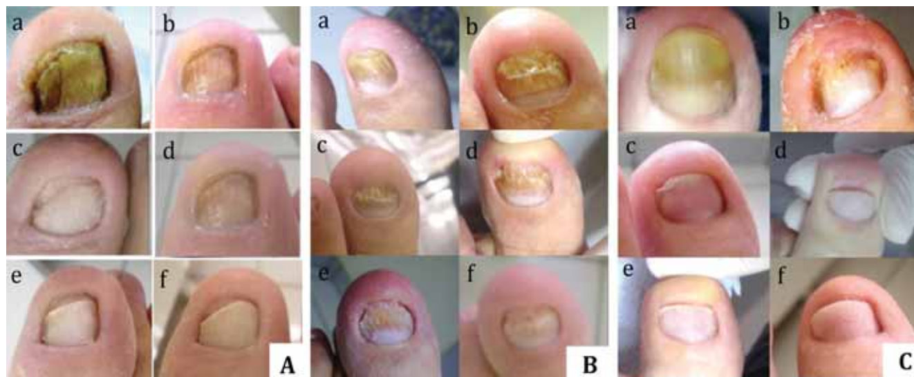
FIGURA 2: Aspecto das unhas antes e durante o tratamento. A. paciente 1; B. paciente 2 e C. paciente 3; (a) antes do tratamento; (b) após 2 meses; (c) após 4 meses; (d) após 6 meses; (e) após 8 meses e (f) após 12 meses de tratamento

que não apresentam resultados controlados rigorosamente. 8 Para confirmarmos a eficiência do método, já estão sendo realizados testes com maior número de pacientes, associando a aplicação do vapor