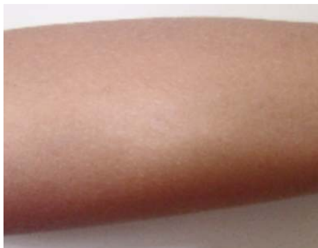
FIGURA 2: Contactante (Prima) de 6 anos - Placa hipocrômica de 3cm, com microtubérculos, no interior; no antebraço esquerdo

Os exames histopatológicos de ambos os contatos demonstraram hanseníase da forma tuberculoide (Figuras 4 e 5).