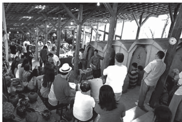
Figura 6: Foto de abertura de forno no Ateliê Suenaga e Jardineiro.

[Figure 6: Photograph of kiln opening in the Suenaga and Jardineiro Studio.]