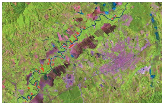
Figura 1 - Cavas de areia - ano 1993 (em Vermelho).