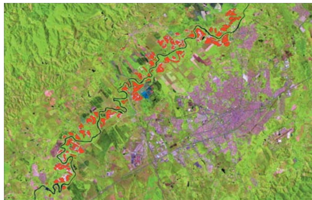
Figura 2 - Cavas de areia - ano 2003 (em Vermelho).