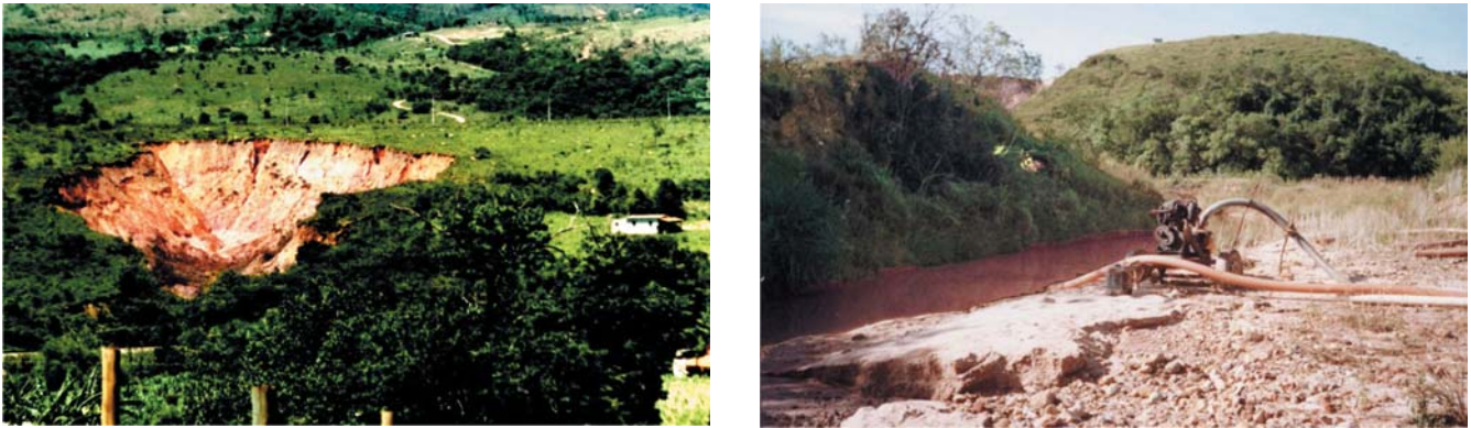
Figura 2 - Voçoroca (A) na bacia do Ribeirão Carioca e equipamento para extração de areia (B) às margens do ribeirão Saboeiro, afluente do ribeirão Carioca.