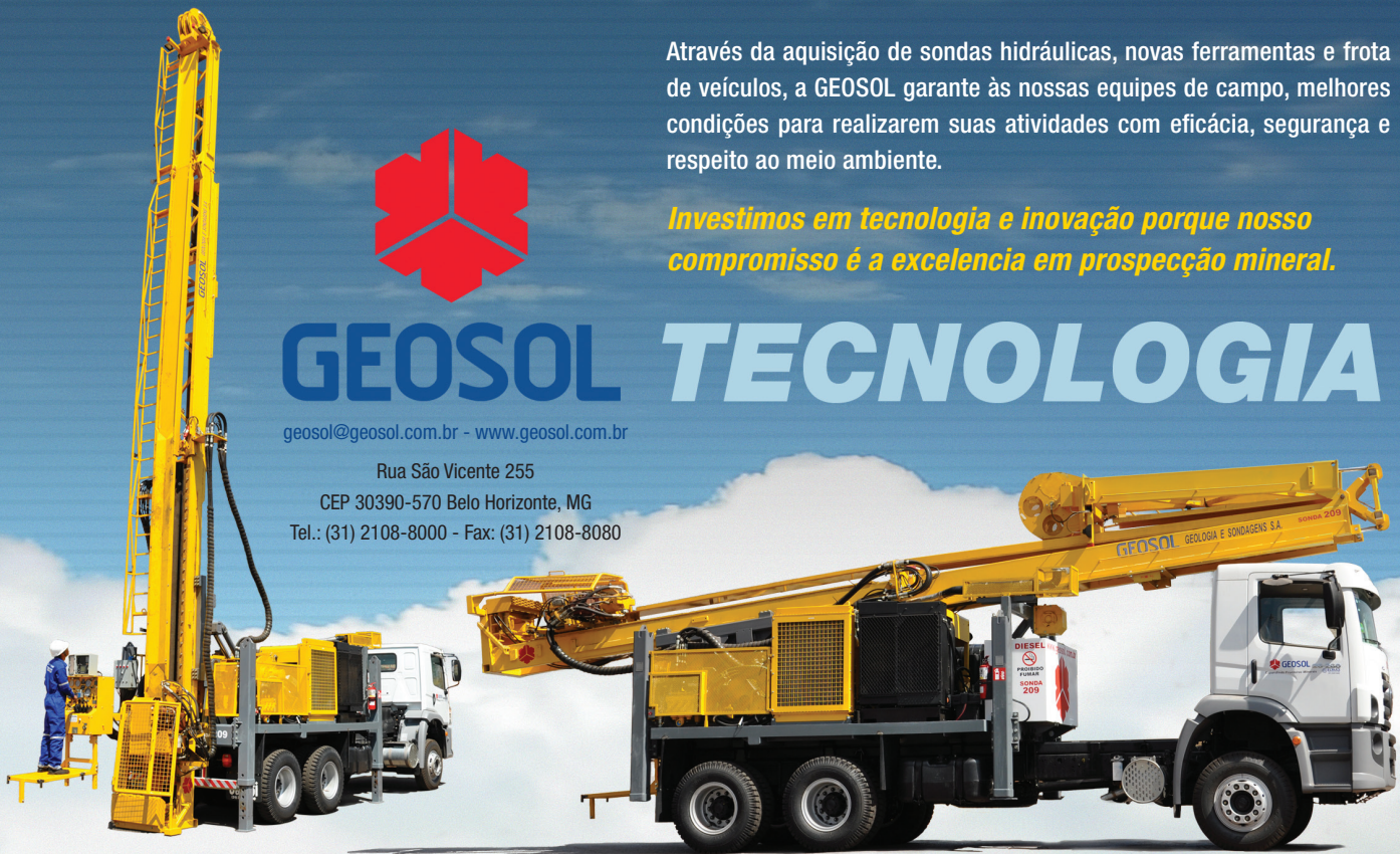
Atlas Copco CS4002 uma das novas sondas da GEOSOL • Capacidade: N Wireline 2,450 m • N Wireline - Upset Ends 2,850 m • H Wireline 1,600 m • H Wireline - Upset Ends 2,250 m • P Wireline 1,050 m

Investimos em tecnologia e inovação porque nosso compromisso é a excelência em prospecção mineral.