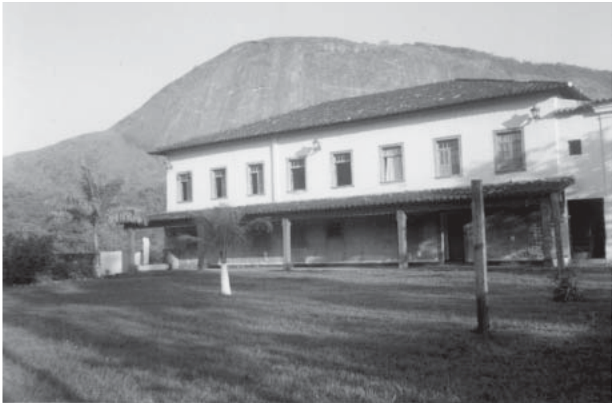
Foto 1 – Casa central do Engenho Sossego, hoje sede do Hotel Fazenda Século XVIII