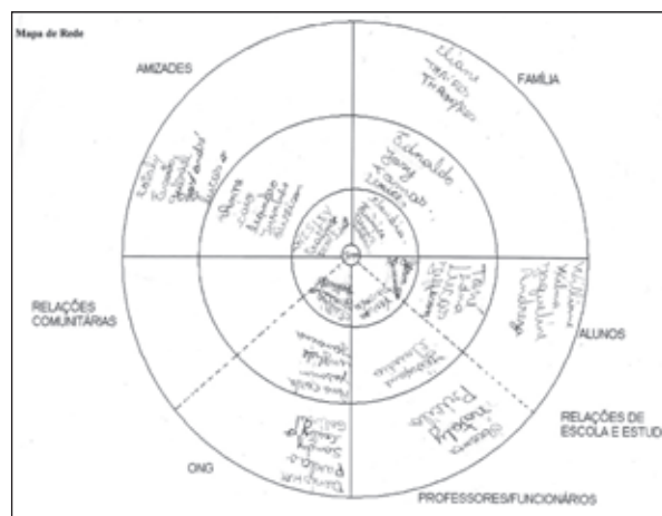
Figura 2: Mapa de rede – Joyce