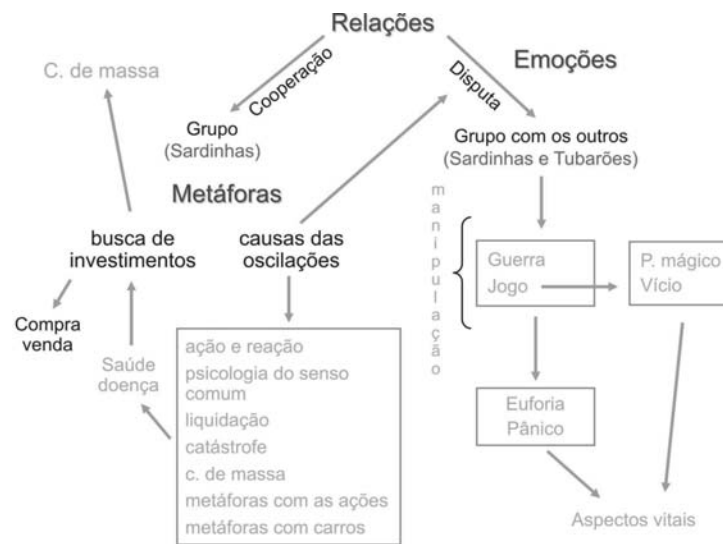
Figura 2. Relações entre as representações sociais do grupo.

Além destas, o grupo também utiliza metáforas de relação afetiva (58,73%). Nesta categoria foram agrupadas as falas nas quais as ações, o IBOVESPA, ou o mercado aparecem, não como sendo uma instituição, mas com características de seres humanos. Assim, as falas dão a impressão de que os investidores estão conversando com as ações: “Querida Vale5, quero te desejar um feliz natal e agradecer por todo o lucro que me deste em 2004”(258), ou contando para algum amigo a proeza de alguém: “ela é assim mesmo, muito temperamental, bate o pé, faz beicinho e não anda; é do tipo ame-a ou deixe-a; he he