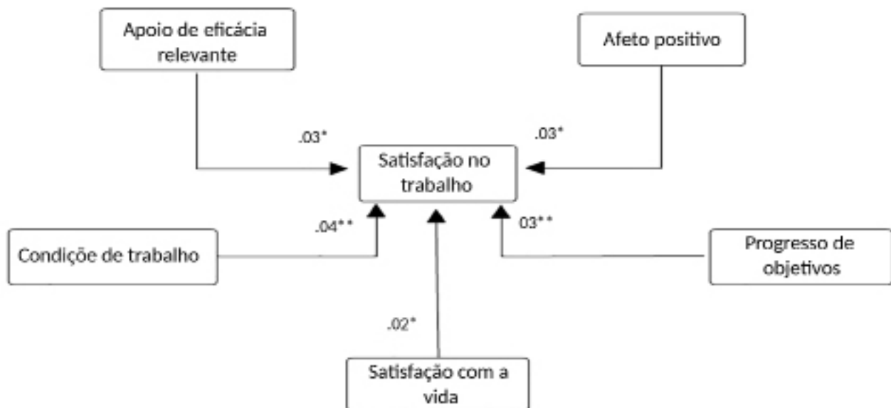
Figura 1. Relações Explicativas entre as Variáveis do MSCST. * p < 0.01 ; ** p < 0.05 .

Isoladamente, as variáveis apoio de eficácia relevante , afeto positivo , condições de trabalho , progresso de objetivos e satisfação com a vida também apresentaram pouca capacidade de explicação referentes à satisfação no trabalho docente (< 1% cada uma). Isto sugere que tanto isoladamente, quanto em conjunto as variáveis do MSCST explicam pouco a variação dos níveis de satisfação dos professores que compõem a amostra selecionada.