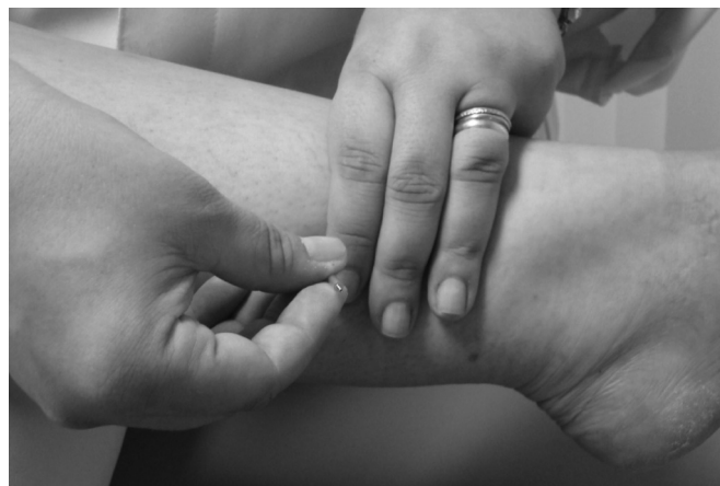
Figura 1. Inserção da agulha para a aplicação da PTNS com o auxílio de um mandril de plástico.

Com relação ao exame urodinâmico, não se observou diferença estatisticamente significativa em nenhuma das variáveis investigadas antes e após o tratamento. No entanto, é preciso reportar que as capacidades cistométricas máximas pré e pós-PTNS foram obtidas somente para 8 mulheres. Nas outras três, a medição foi prejudicada pela perda involuntária de urina durante o enchimento em uma das condições (pré ou