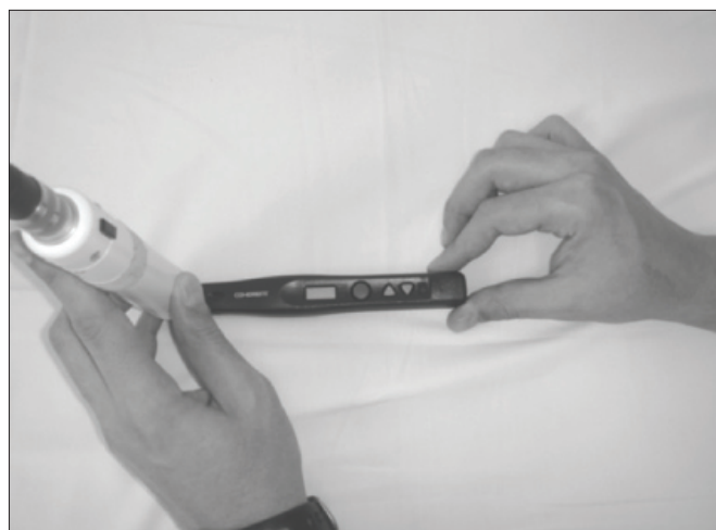
Figura 2. Simulação da análise de um equipamento de LBI e a consequente aferição da PmR pelo potenciômetro.