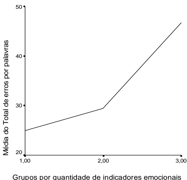
Figura 1. Relação das médias do total de palavras erradas conforme as categorias de indicadores emocionais

O estudo para avaliar até que ponto as crianças diferem no que se refere ao total de erros por palavras em razão das categorias de intensidade de problemas emocionais mostrou que a diferença entre as médias de erros no ditado não pode ser atribuída ao acaso ( F = 3,250 ; p = 0,044 ). A Figura 1 mostra essa relação.