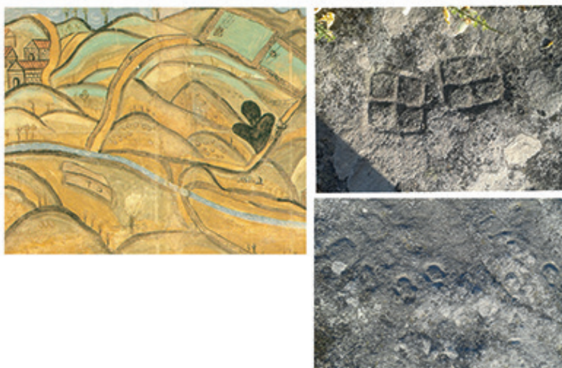
Figura 4. Esq. Plano de parte da paróquia de São Edro de Cudeiro desde a aldeia de Cudeiro até Oira, 1663 (A.R.G, Col. Cart. R.A 56). Dir. Insculturas de cruzes e ferraduras das Pegadinhas da Nossa Senhora (Vilar de Perdizes, Montalegre).

Outro exemplo interessante com semelhanças com os rituais acima estudados é o da lenda de fundação do mosteiro de Ilha de Tambo (Poio, Pontevedra, Espanha), segundo a qual o arcanjo São Gabriel aparece ao fundador e lhe ordena construir o cenóbio na ilha no lugar onde encontrar-se com um touro amarrado. A lenda, até aqui não muito distinta de outras lendas que explicam de igual modo o estabelecimento de lugares de culto, contém uma segunda ordem dada pelo anjo, que a aproxima das tradições circunvalares fundacionais que temos tratado; o anjo ordena que os alicerces da igreja sejam postos sobre o caminho percorrido pelo touro: “Mandando abrir os alicerces da igreja em um sítio em que acha-se um Touro atado e que o âmbito de aquela fosse quanto o Touro há pisado” (Pazos, 1996, p. 18). A estas associações jurídico-rituais não escapa um costume de direito consuetudinário presente no País Basco, segundo o qual, para fazer-se com a propriedade de um terreno de pastagem ( sele ), o interessado deveria deixar, durante a noite de São João, um boi semental pastando atado à pedra que marcava seu centro 20 ; se o animal seguisse para lá na manhã seguinte, o gesto era entendido como uma tomada de posse efetiva (Lasa, 1964, p. 163).