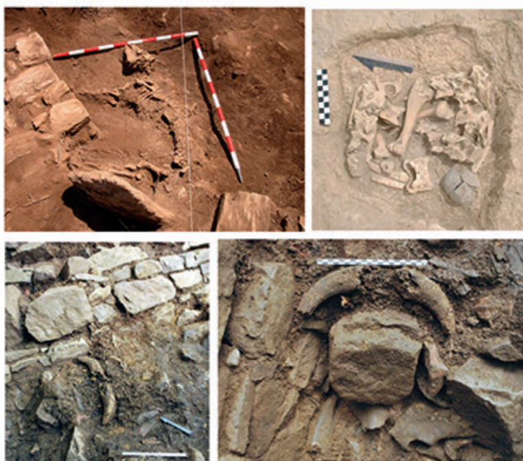
Figura 3. Alguns depósitos animais em contexto doméstico. Acima: cão sob a soleira de uma casa galaico-romana, castro de Neixon (Boiro, Corunha); fossa com ossos de ovicaprídeos e vaso do castro Cerro de La Mesa (Alcolea de Tajo, Toledo) (Cabrera, 2010). Abaixo: depósito faunístico sob os alicerces da cabana C-2, castro de Vigaña (Belmonte de Miranda, Astúrias) (González, 2016).

Nas Ilhas Britânicas conhecem-se depósitos animais vinculados à defesa de povoados da Idade do Ferro. Em Maiden Castle (Dorset) encontrou-se o esqueleto de um cão no caminho de uma das entradas (Buchsenschutz e Ralston, 2007, p. 176). Em Crickly Hill (Gloucestershire) encontraram-se vários restos de animais sob os postes que formavam a estrutura da porta, repartidos de modo intencional entre os lados esquerdo – mandíbulas de javali – e direito – duas cabeças de cabra (Ralston 2006, p. 139). Sob a muralha do castro escocês de Eildon Hill North encontrou-se uma fossa com ossos de diversos animais, entre eles dentes de cavalo adulto (Büchschütz e Ralston, 2007, p. 176). No oppidum de Mont Vully (Suíça) aparecera, num poste da entrada, o maxilar de um boi (Von Nicolai, 2009, p. 79); na porta oeste do castro Blewburton Hill (Berkshire) foram encontrados dois depósitos formados por uma parilha de cavalos (Ralston, 2006, p. 138), assim como cabeças de cavalos possivelmente apareciam expostas nas portas do oppidum de Dünsberg, segundo a interpretação de Von Nicolai (2009, p. 85).