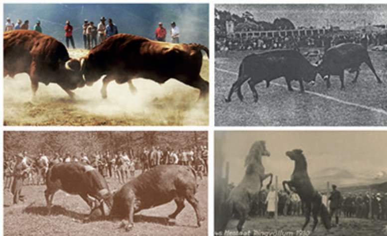
Figura 8. Combates de equídeos e bóvídeos na Europa: 1. “Chega de bois” em Fojo, Castro Daire, Portugal; 2. “Bataille des Reines”, Val de Aosta (Itália); 3. “Engarra” de bois tudancos, Cantábria, Espanha (García Lomas, 1949: Pict. XVII-1); 4. “Heestat”, luta de cavalos, Islândia.

durante a década dos 1930, graças ao qual se resolveu o conflito entre dois povos vizinhos – não especificados –, luta que significativamente ocorreu justo na fronteira entre ambos concelhos.