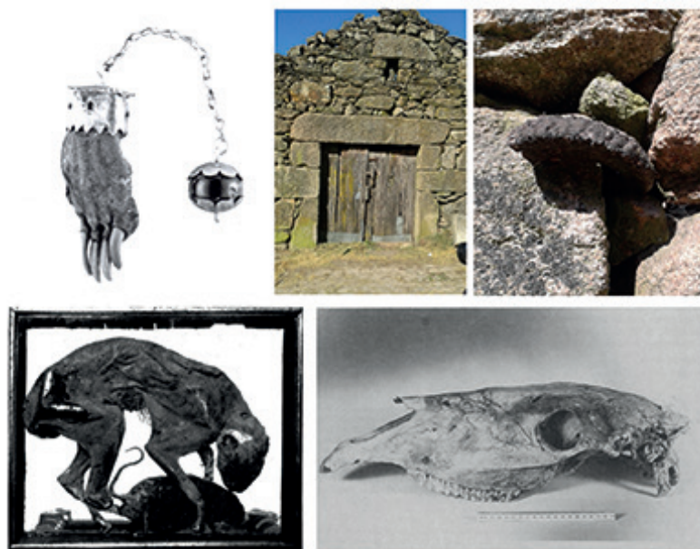
Figura 2. Depósitos de fundação e amuletos. Acima: amuleto com garra de texugo (Sanguesa, Navarra), Museu do Traje, Madrid (González Pérez, 2015); casa em Pitões das Júnias (Montalegre, Portugal) com chifre de carneiro incrustado entre as pedras próximas à porta, vista geral e detalhe. Abaixo: gato em posição de caçar uma rata em um depósito doméstico, exposto no Salinsbury Museum (Howard, 1951); crânio de cavalo depositado em uma casa de Ballaugh, Ilha de Man (Hayhurst, 1989).

entrar em uma nova morada: “antes que pasen los vivos, es de necesidad que pase un muerto...” 8 (Cabal, 1992, p. 17-20). Na Bretanha, contava-se que a morte personificada – o Ankou – sentava na soleira das moradas novas, à espera do primeiro que a cruzasse (Le Braz, 1923, p. 157s). Crenças similares justificavam, na Península Ibérica, o sacrifício de um animal ao inaugurar a vivenda (Cabal, 1992, p. 17; Violant, 1947, p. 180). Em Madrid existia, ainda no século XIX, a crença segundo a qual se uma família se mudasse para uma morada recém-construída, em pouco tempo morreriam alguns dos seus membros; para evitá-lo, levava-se um cordeiro para o seu interior e o deixavam lá durante uma noite; no dia seguinte, o cordeiro era sacrificado e todos os membros da família tinham de comê-lo para estarem a salvo (Olabarria, 1884, p. 79). Na Escócia, dizia-se que a construção de uma nova morada levava seu proprietário à morte em breve (Gregor, 1891, p. 173). Também relacionado a isso, encontram-se costumes como o de enterrar sob a casa recém-construída a cabeça da primeira vaca que morrera na propriedade, como sucedia no condado irlandês de Leitrim (O’Suilleabháin, 1945, p. 47s).