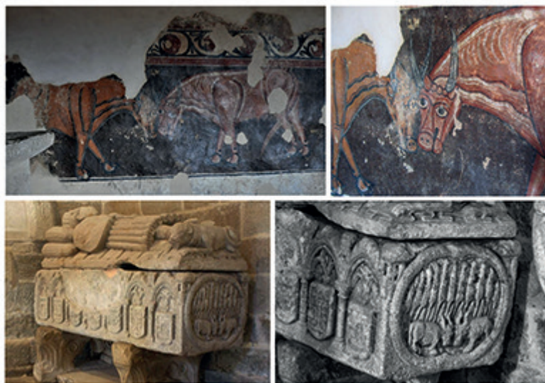
Figura 6. Iconografia dos combates de touros na Idade Média Peninsular. Acima, ermida de St. Baudelio de Berlanga, Casillas de Berlanga (Soria). Abaixo, Tumba de Johan de Estivadas igreja de St Maria de Noia (Corunha).

Os dados relativos à variante festiva dos combates de bois/touros/vacas são muito mais abundantes e extensos geograficamente no norte de Espanha. No concelho de Caso, na própria Astúrias, celebrou-se até praticamente meados do século XX a chamada Fiesta de los Toros – Festa dos Touros –, que reunia os 21 povos do concelho, realizada a 8 de outubro, coincidindo com a feira de gado e com o período de baixada dos gados desde as pastagens altas de verão. Nela enfrentavam-se os melhores reprodutores de cada aldeia para se ver qual o melhor (Alvárez Peña, 2016, p. 80). Combates similares de touros – engarras – faziam-se também no concelho de Ponga (Astúrias), entre março e maio, no chamado “tempo das pastagens” – tiempo les paciones –, coincidindo com a subida estacional do gado desde o vale às brañas (Alvárez Peña, 2016, p. 81). Combates tinham lugar na província vizinha de Leão, em Montrondo (Omaña), onde eram realizadas entre maio e junho, e no povo de Matalavilla, que ocorria a 24 de junho, coincidindo com o dia de São João (Alvarez Peña, 2016, p. 81). Em todos estes casos, os combates de touros relacionavam-se a um sistema de pastagem baseado na alternância entre as zonas altas no verão e no fundo do vale durante o inverno. Costume semelhantes existia também na região de Tudanca, em Cantábria (Espanha), recebendo igualmente o nome de engarra (García Lomas, 1949, lam. XVII-1), assim como na samorana Terra de Alva (Rodríguez e Rodríguez, 1983, p. 133).