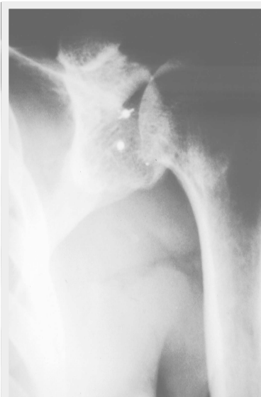
Figura 4 - Radiografia em Ap no pós-operatório, mostrando o posicionamento das âncoras.

O retorno a atividades esportivas deu-se em 16 atletas (76,19%). Destes, apenas dez retornam às atividades do período pré - lesional na mesma intensidade. Os seis restantes que referiram ter retornado de maneira parcial ao esporte apontaram o medo de uma nova luxação como causa da não reabilitação por completa. Dos sete pacientes que referiram abandono das atividades físicas, dois (9,52%) relataram dor residual, um (4,76%) dor as-