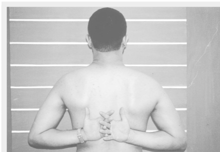
Figura 5 - Exame físico após oito semanas do período pós-operatório, mostrando rotação interna e adução atingidos.