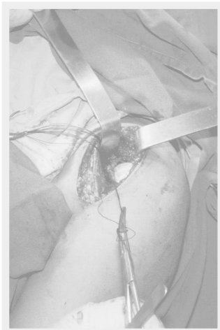
Figura 2 - Incisão do tendão subescapular, separado da cápsula por fios de algodão.

Figure 1 - Anterior incision from axillary fold toward the coracoid.