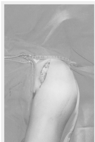
Figura 1 - Incisão anterior da prega axilar no processo coracóide.

A seguir, prosseguiu-se o fechamento da cápsula. O retalho inferior foi primeiramente fechado e depois rodado o retalho superior no sentido inferior com a posição do membro rotação externa de 10 graus,