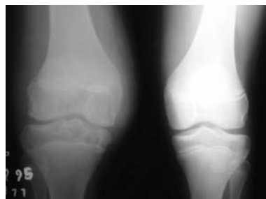
Figura 5 - Radiografia do caso 3.