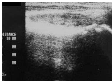
Figura 7 - Medida da sinovial.

e lesões ósseas. Existem recomendações de atuar precocemente na membrana sinovial para evitar o dano da cartilagem articular e interferir na história natural da doença, com o objetivo de evitar a degeneração articular (2,10) .