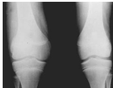
Figura 2 - Radiografia do caso 1.