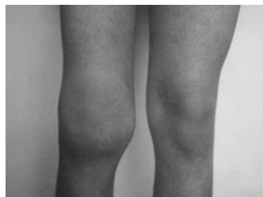
Figura 4 - Aspecto clínico do caso 3.