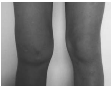
Figura 1 - Aspecto clínico - caso 1.

A AH em fase subaguda é uma artropatia de natureza inflamatória, em que as hemartroses sucessivas provocam inflamação sinovial e aumentam a susceptibilidade a novas hemorragias, estabelecendo um ciclo vicioso. A articulação que sofre este processo durante a adolescência terá como seqüela uma artropatia degenerativa grave com lesão da cartilagem articular, contratura fibrosa da cápsula articular