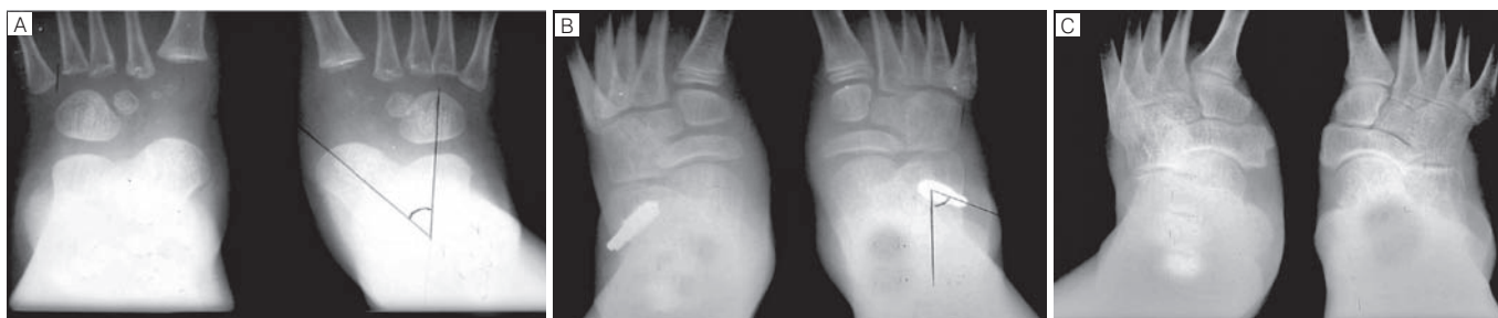
Figura 4 – Radiografias do caso 2 em incidência AP, no pré-operatório (a), no pós-operatório (b) e na revisão final (c).