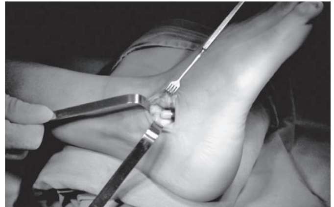
Figura 1 – Aspecto intra-operatório da colocação do parafuso de Pisani.

Foi elaborada uma Ficha de Avaliação Clínica contendo questionário, dados do prontuário e do exame físico. Os pés operados foram classificados como resultados satisfatório e insatisfatório na revisão final, baseando-se exclusivamente em critérios clínicos. As figuras 2 e 3 mostram exemplo de pés com resultado satisfatório. Para considerar um pé clinicamente satisfatório foi necessário o preenchimento de todos os seguintes critérios, sem exceção: correção do valgismo