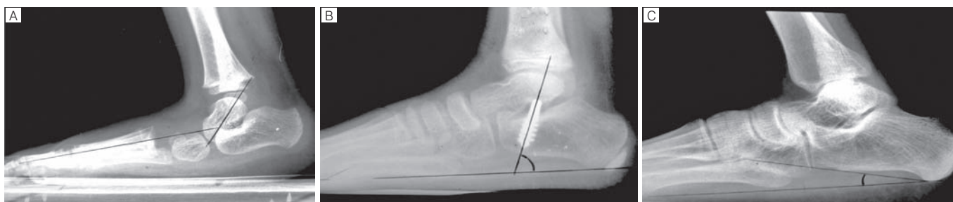
Figura 5 – Radiografias do caso 2 para o pé esquerdo em posição ortostática, incidência perfil no pré-operatório (a), no pós-operatório (b) e na revisão final (c).