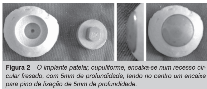
Figura 2 – O implante patelar, cupuliforme, encaixa-se num recesso circular fresado, com 5mm de profundidade, tendo no centro um encaixe para pino de fixação de 5mm de profundidade.

Aplicou-se dreno aspirativo deixado por um período de 24 a 48h, finalizando-se com a sutura por planos das estruturas incisionadas e uso de enfaixamento compressivo inguino-maleolar. (Figura 3) Todos os pacientes receberam 2g de cefazolina endovenosa 30 minutos antes da indução anestésica como profilaxia, continuando com 1g de 8/8h até o terceiro dia pós-operatório. A recuperação funcional iniciou-se no segundo dia pós-operatório com a movimentação passiva, movimentação ativa no 2º dia e a deambulação com carga total e uso de andador no 3º dia pós-operatório. Seguiram-se os curativos, retiradas de pontos no 14º dia, seguindo-se a marcha sem o auxílio de muletas ou andador. Os pacientes foram examinados e radiografados para avaliação segundo os critérios objetivos estabelecidos pelo "Knee Society