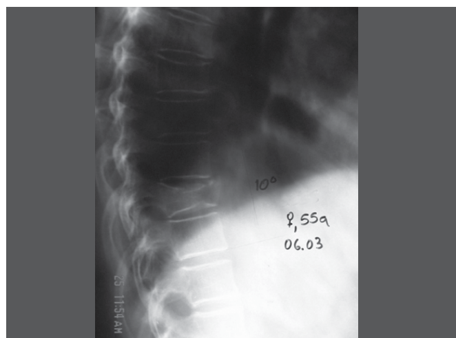
Figura 1. Radiografia de perfil com 10 graus de cifose.

Fonte: McCormack T, Karaikovic E, Gaines RW. The load sharing classification of Spine fractures. Spine 1994; 19:1741-4.