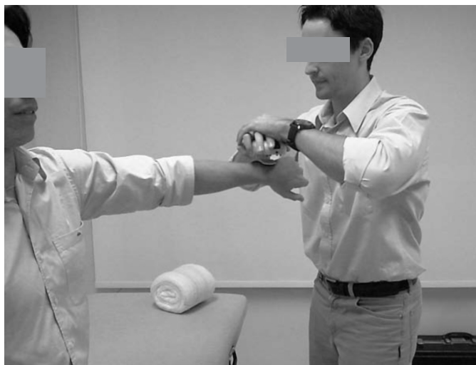
Figura 3. Posicionamento do paciente e do dinamômetro para avaliação da força de elevação dos ombros.

Todas as mensurações de força foram randomizadas e o examinador responsável pela avaliação foi cegado, ou seja, não sabia quais os ombros sintomáticos e os assintomáticos.