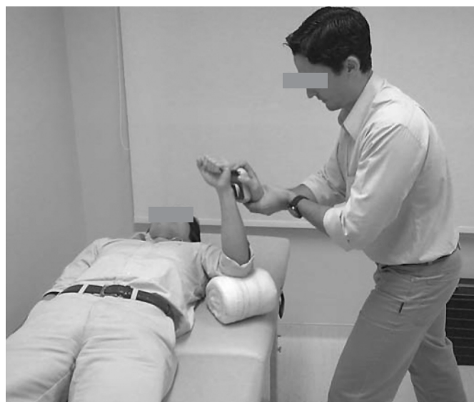
Figura 2. Posicionamento do paciente e do dinamômetro para avaliação da força de rotação lateral dos ombros.