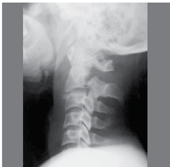
Figura 2. Fratura tipo 2.