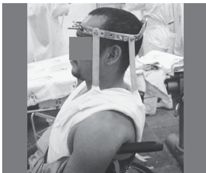
Figura 5. Halo Gesso.