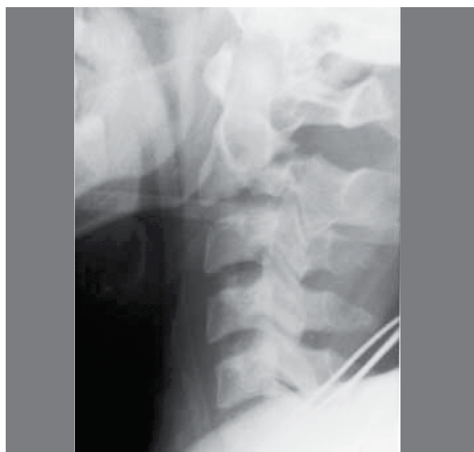
Figura 1. Fratura tipo 1.

A revisão dos prontuários de 16 pacientes tratados no Instituto de Ortopedia e Traumatologia do Hospital das Clínicas da Faculdade de Medicina da Universidade de São Paulo (IOT-HCFMUSP), no período de 2002 a 2010, apontou a presença de onze pacientes do sexo masculino, e cinco do feminino. Os pacientes tinham idade de 19 a 84 anos, sendo, portanto, 39,1 a idade média da amostra. Observou-se fratura do tipo I em cinco pacientes (31,2%). O tipo II foi identificado em oito pacientes (50%) e apenas três pacientes (18%) apresentavam fratura do tipo IIa. Não foram identificadas fraturas do tipo III. (Figuras 1 e 2)