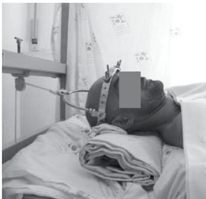
Figura 3. Halo craniano.

Nenhum dos pacientes apresentou complicações decorrentes do tratamento. (Tabela 1)