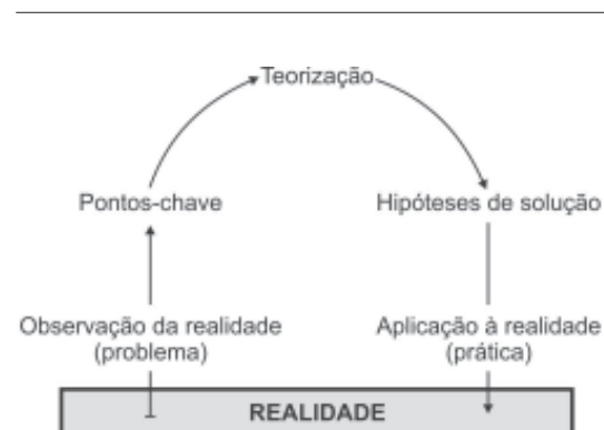
Figura 1. Arco de Maguerez 47 .

Na terceira etapa, o estudante passa à teorização do problema ou à investigação propriamente dita. As informações pesquisadas precisam ser analisadas e avaliadas, quanto à sua relevância para a resolução do problema. Nesse