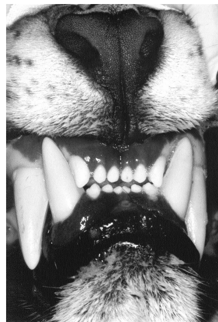
Figura 1 Oclusão normal encontrada na espécie Panthera onca