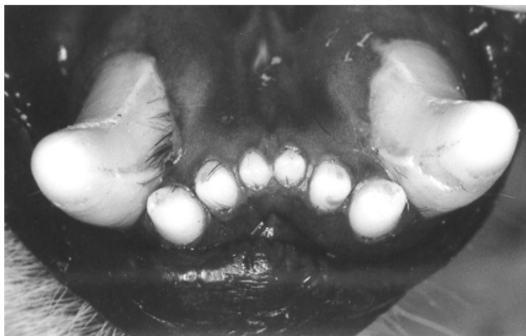
Figura 2 Maloclusão dos dentes incisivos inferiores de Panthera onca , formando um arco com concavidade voltada para região rostral da mandíbula