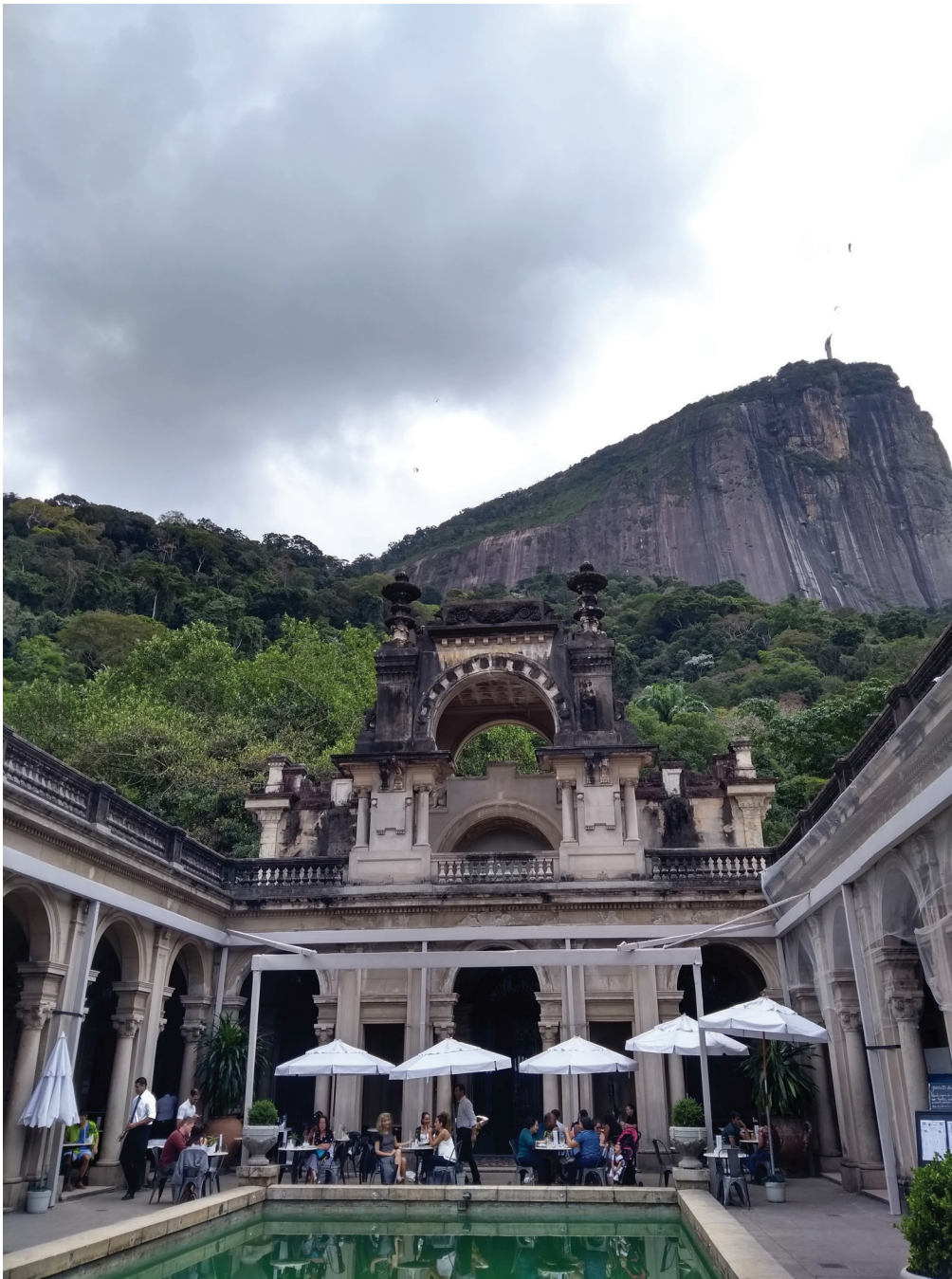
Figura 2. Parque Lage.

Outra imagem da série Cotidiano é uma fotografia da Faculdade de Letras da UFRJ, no campus do Fundão, o mesmo campus onde se localiza a Escola de Belas Artes, onde Luiz estuda. Sobre esse lugar, disse que “A Letras é o meu forte” e, quando questionado o porquê dessa afirmação, respondeu que “é um espaço muito aconchegante, porque o pessoal é muito diverso e muito plural”. Devido a um incêndio no prédio onde estudava, Luiz estava tendo aulas em outros prédios da universidade, sendo a Faculdade de Letras um deles.