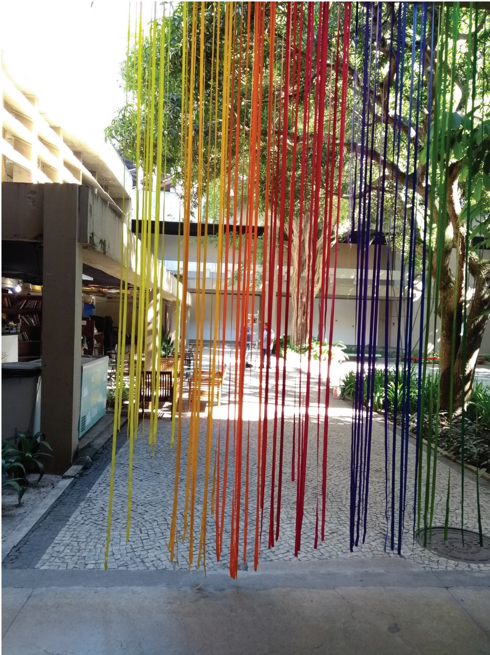
Figura 3. Faculdade de Letras, na UFRJ.

Ah, Letras. Letras é um lugar que eu me sinto muito bem. É minha fortificação. (Luiz)