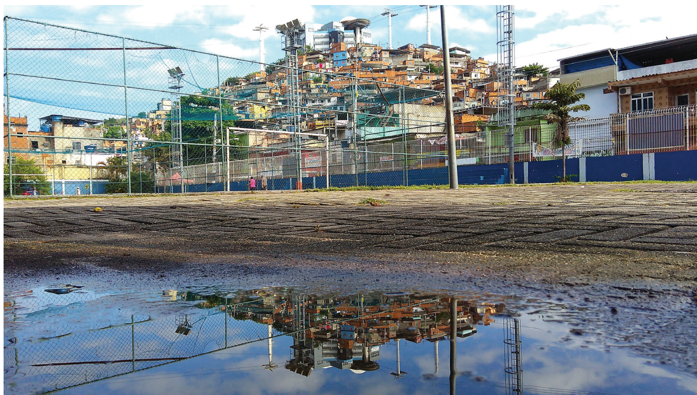
Figura 1. Vila Olímpica do Complexo do Alemão.