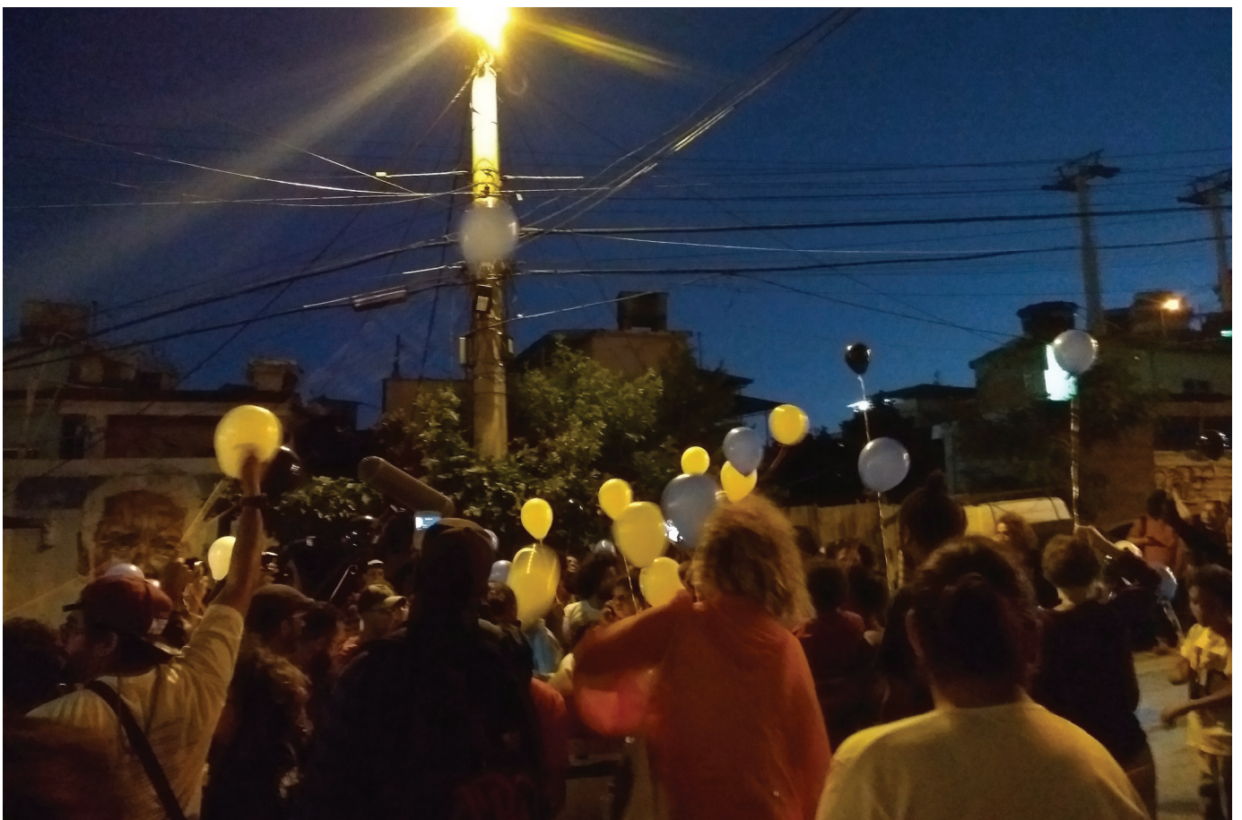
Figura 5. Slam Laje, no Complexo do Alemão.

(l) Informações da página oficial do Slam Laje no Facebook: https://www.facebook.com/batalhadepoesia/