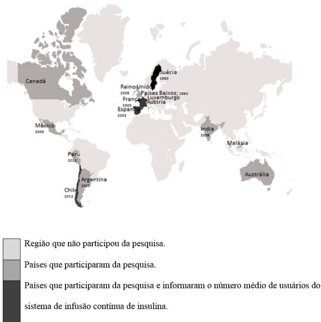
Figura 1. Países entrevistados e ano de incorporação do sistema de infusão contínua de insulina

Minas Gerais, Goiás e Amapá), das quais cinco já haviam recebido demandas judiciais para o SIC. Além disso, todas, exceto Tocantins, têm notado aumento na demanda judicial nos últimos cinco anos (Figura 3). Dentre as secretarias que participaram, apenas Amapá e São Paulo informaram que estão avaliando a tecnologia baseando-se em evidências científicas.