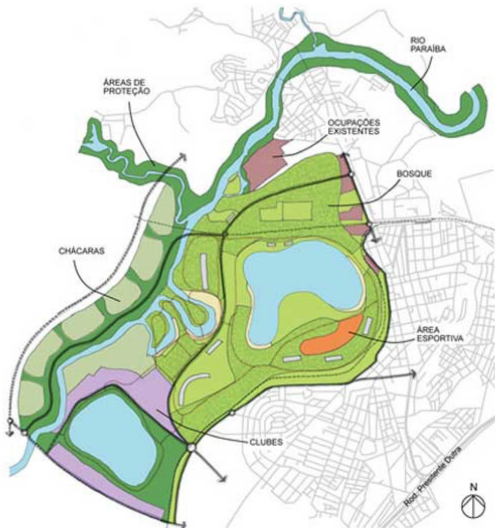
Figura 3 – Projeto do Parque Regional do Banhado