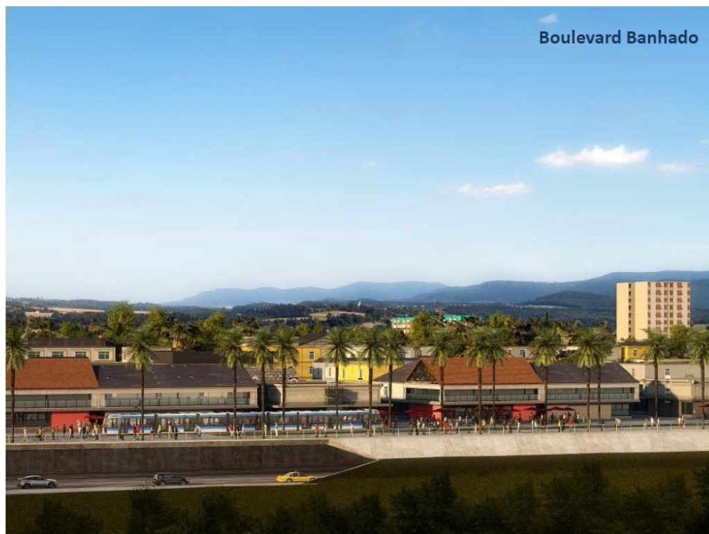
Figura 5 – Boulevard Bahado (Projeto)