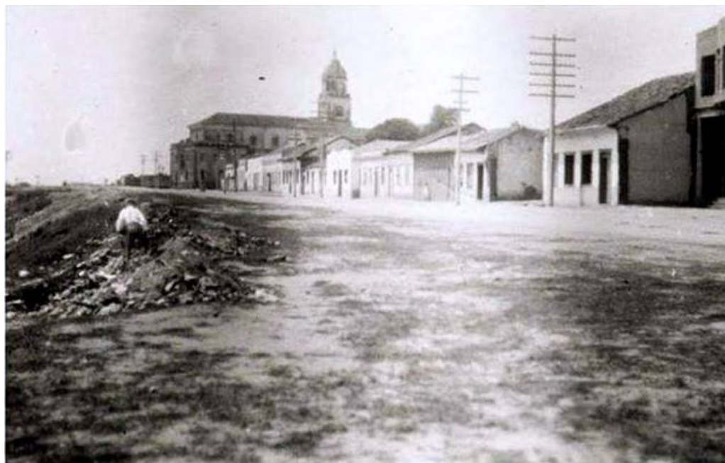
Figura 2 – Rua São José depois da desapropriação, 1939-1940

No ano seguinte, um Ato Institucional, proclamado pelo periódico local, o Correio Joseense , como ação de extrema urgência, ampliou o número de casas a serem demolidas (SÃO JOSÉ DOS CAMPOS, 1939). Na prancheta do engenheiro sanitário, o “mar” ganhava sua “orla”, a paisagem adquiria valor cênico, emoldurando e embelezando o entorno que o plano urbanístico almejava tornar estética e simbolicamente urbano (Figura 2).