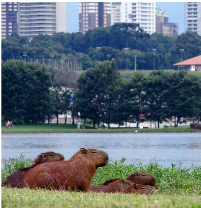
Figura 2 – Capivaras no Parque Barigui (Curitiba, Brasil)