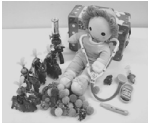
Figura 2: Material utilizado no processo de revelação diagnóstica

e conta com o emprego de materiais lúdicos que servem como apoio para as informações sobre a doença e importância do tratamento. Como instrumentos para a abertura diagnóstica são utilizados brinquedos coloridos que incluem: um boneco; quatro soldadinhos que representam as células de defesa – Linfócitos T CD4+; brinquedos que simulam os objetos utilizados pelo médico (estetoscópio, termômetro, injeção, bloco de receituário, entre outros); bolinhas de borracha que representam o HIV; microscópio; seringa e brinquedos para demonstração de diferentes doenças (Figura 2). O material criado especificamente para a finalidade da revelação diagnóstica foi elaborado por profissionais de diferentes áreas. Fruto de uma reflexão global, multidisciplinar e da prática clínica, a história contada envolve a metáfora dos soldadinhos, que representa as células de defesa e que devem permanecer fortes e numerosos para combater as doenças. Com o passar do tempo, as explicações foram sendo modificadas e testadas em função dos comentários e reações das crianças submetidas ao seu uso.