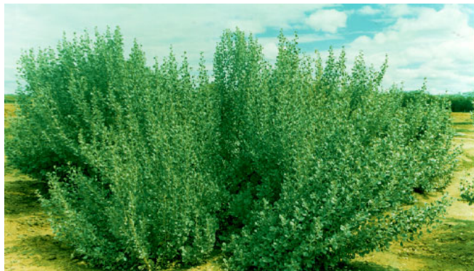
Figura 2. Atriplex nummularia irrigada com o rejeito da dessalinização de água salobra, com um ano de idade

Na Tabela 2 tem-se o peso total em matéria fresca de cada uma das parcelas colhidas de Atriplex nummularia , após um ano de idade. Por sua vez, cada parcela é constituída por 16 plantas, produzindo uma média geral de 23,4 kg de material por planta. O total de produção de todo o conjunto de plantas da área é de 4.504,0 kg, alcançando a produtividade de 26.064,0 kg ha -1 colhido, considerando-se a densidade de plantio de 1.111 plantas ha -1 .