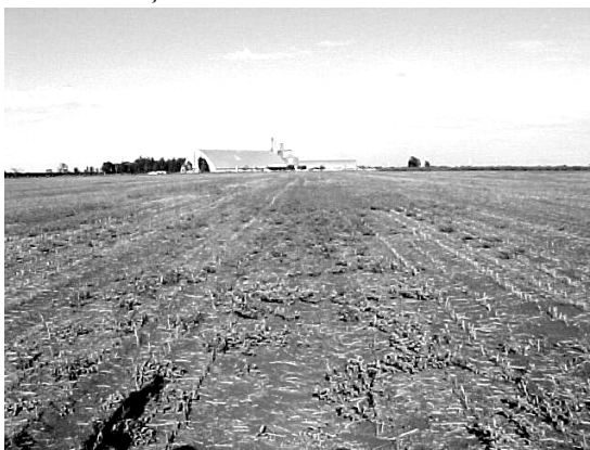
Figura 1. Condições encontradas no campo experimental durante o primeiro mapeamento: baixa (A); média (B); e alta (C) infestação de plantas daninhas

A representação do mapa de plantas daninhas obtida no primeiro mapeamento pode ser observada na Figura 2A. Na área total, de 72 ha, 13,47% ou 9,7 ha foram compostas por reboleiras de alta infestação de plantas daninhas, 82,88% da área total ou 59,67 ha se compunham de reboleiras de média infestação, e 1,67% da área total, ou 2,63 ha, por reboleiras de baixa ou nula infestação.