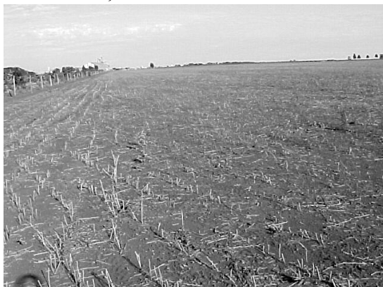
B. Média infestação