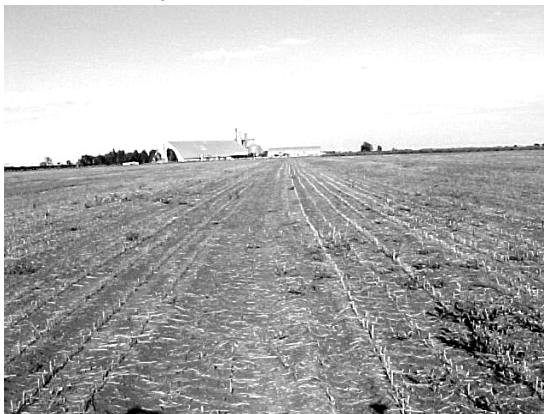
C. Alta infestação