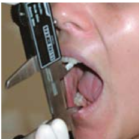
FIGURA 2 - Distância interincisiva máxima.

Na ausência dos dentes incisivos centrais superior e/ou inferior direitos, foi medida a distância