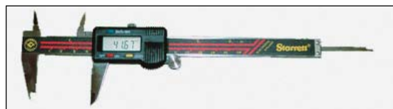
FIGURA 1 - Paquímetro digital.

Os critérios de seleção das crianças para inclusão neste estudo foram: a) histórico fonoaudiológico