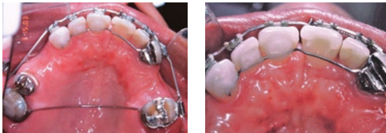
FIGURA 4 - Sistema de ancoragem utilizado no caso exposto.

Inicialmente foram realizadas as extrações, a terapia periodontal, os retratamentos endodônticos e as restaurações. Antes do início da reabilitação protética e já com a doença periodontal controlada, foi solicitada à Disciplina de Ortodontia uma avaliação do caso. Constatou-se que a paciente apresentava uma face equilibrada, perfil convexo e um bom selamento labial (Fig. 2).