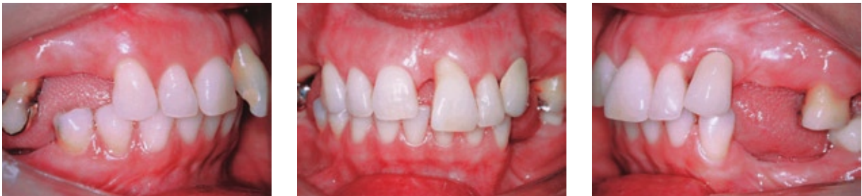
FIGURA 3 - Aspecto intra-oral da paciente previamente ao tratamento ortodôntico.