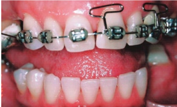
FIGURA 5 - Arco 0,017" x 0,025" com T-loops utilizados na intrusão dos incisivos.