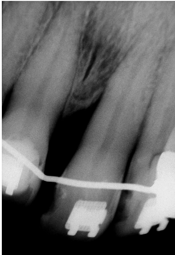
FIGURA 6 - Radiografias periapicais pré e pós- intrusão.