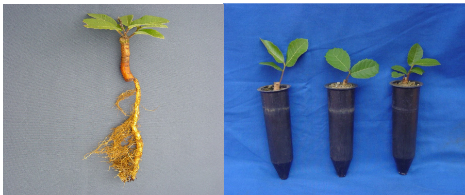
FIGURA 1. Mudras de Brosimum gaudichaudii Tréc. produzidas a partir de estacas de raiz em tubetes.

substrato. A aplicação de ANA proporcionou redução significativa no número médio de folhas. Os demais parâmetros não foram afetados pelos tratamentos. As estacas com diâmetro médio de 0,87 cm e 0,67 cm proporcionaram maiores valores para todos os parâmetros. Observou-se que o comprimento das raízes pivotantes variou de 3,5 cm até 14 cm, sendo maiores nos substratos S1 e S2 e no tratamento com AIB (Figura 1).