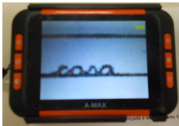
Figura 1 – Sistema de Vídeo e Magnificação portátil A-MAX

Para perto foi prescrito o Sistema de Vídeo e Magnificação portátil A-MAX (Figura 1) que apresenta as seguintes características: tela de LCD com 3,5, bateria recarregável com duração de 3 horas, carregador USB, ampliação da área de visão de 2 a 15 vezes, confeccionado em material plástico na cor laranja e preto, peso 100 g, auto desliga, com recurso de imagem congelada e modo de visualização inverso de cores, visualização de texto e cores de fundo (preto no branco e branco no preto). O auxílio foi adquirido, foi realizado treinamento e encontra-se em uso pelo escolar.