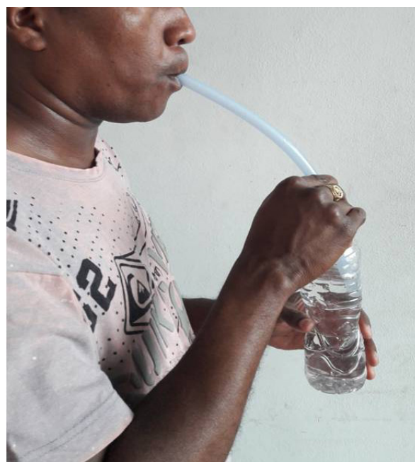
Figura 2. Execução da Técnica Lax Vox®

Para a análise do efeito imediato da técnica vocal Lax Vox® em cantores com queixas e sintomas vocais, foram consideradas as seguintes variáveis dependentes: 1) análise acústica da voz; 2) análise perceptivo-auditiva da qualidade vocal; 3) avaliação eletroglotográfica; 4) análise visual da imagem laringea; e 5) avaliação aerodinâmica. Todos os procedimentos de coleta das variáveis dependentes são detalhados a seguir.