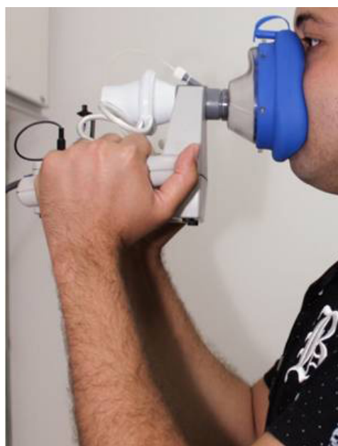
Figura 4. Realização da avaliação aerodinâmica

Para coletar as medidas aerodinâmicas, os participantes foram orientados a emitir a sílaba /pá/ repetidamente na f_0 habitual em uma única expiração. Para a captação dos parâmetros aerodinâmicos foi usada uma máscara facial de silicone, colocada sobre a boca do participante. A máscara foi acoplada a um dispositivo conectado a um transdutor de pressão. A pressão intraoral foi medida por meio de um cateter de polietileno com pequeno diâmetro, inserido na máscara através de um orifício lateral, posicionado na parte central da língua do participante. A outra extremidade do cateter foi conectada a um transdutor de pressão e a um microfone e todos os sinais emitidos foram gravados e analisados pelo programa (Figura 4).