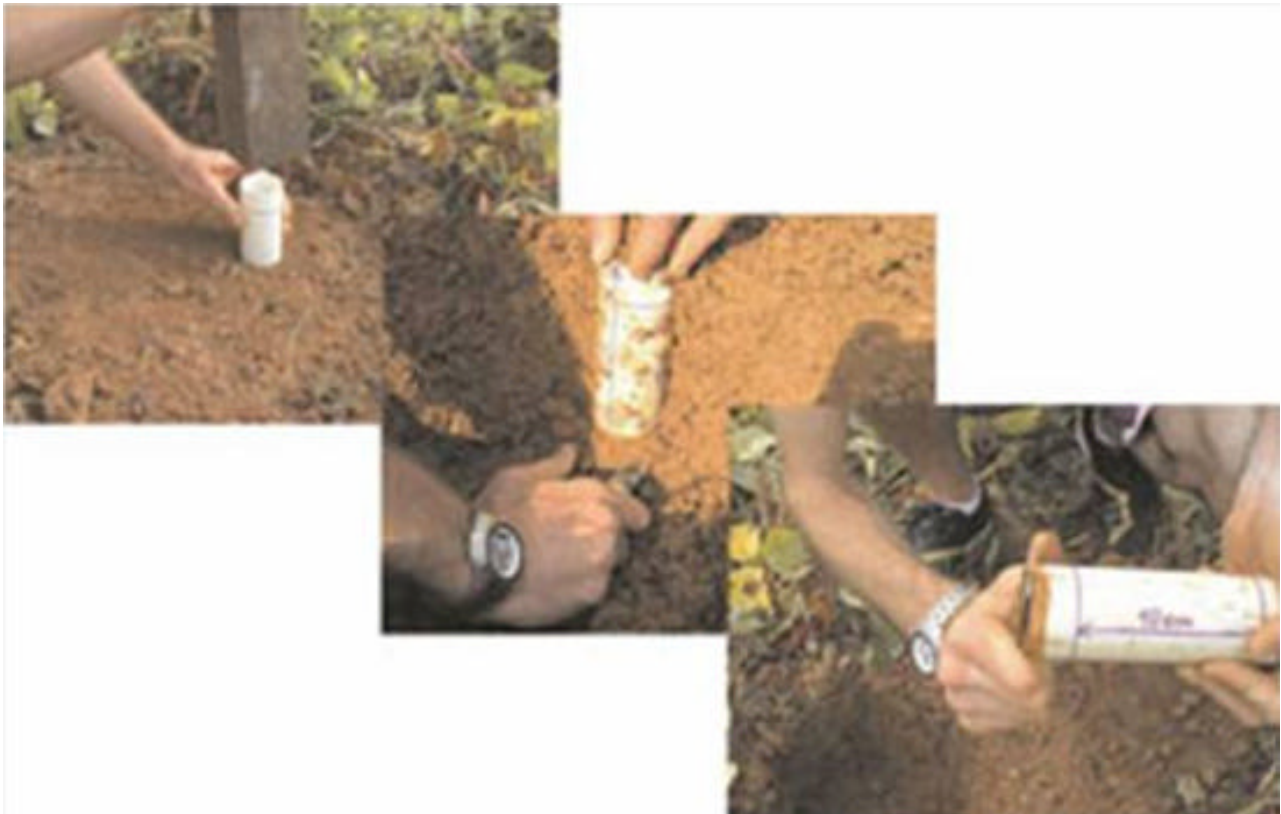
Figura 2 - Retirada e preparo de amostra de solo para determinação de sua densidade.

- Coloca-se o recipiente com solo dentro do forno microondas, com regulagem na potência máxima. Depois de 3 minutos, retira-se o recipiente do forno microondas e pesa-se a massa de solo;