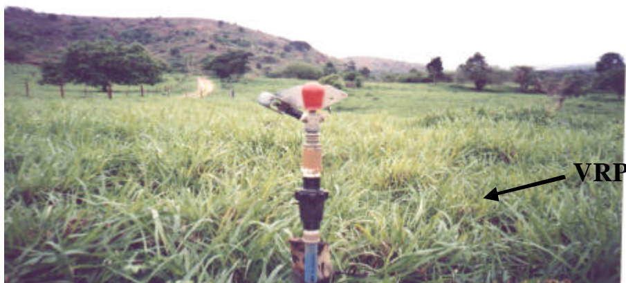
Figura 3 – Aspersor rotativo de baixa pressão e de um bocal, com válvula reguladora de pressão (VRP).

Um dispositivo que corrige a diferença de pressão de serviço entre aspersores são as válvulas reguladoras de pressão (Figura 3). Essas válvulas reagem a um acréscimo de pressão de entrada (ou de saída, dependendo do tipo de válvula) diminuindo a seção de passagem de água e aumentando a perda de carga localizada que ocorre na