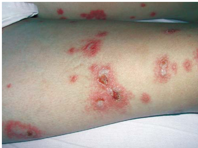
Figura 1. Placas eritematosas com pústulas na coxa direita

Após seis dias, a paciente apresentou grande piora do quadro. Apresentava-se dispnéica, com edema de membros inferiores e superiores e persistentemente febril. As lesões de pele coalesceram, tornaram-se pustulosas e bolhosas e disseminaram-se (Figura 1). A radiografia de tórax apresentava infiltrado alveolar "em vidro fosco" em todo o pulmão esquerdo e derrame pleural ipsilateral com colapso parcial do lobo inferior (Figura 2). Foi realizada toracocentese e a análise do líquido pleural apresentava hemácias 2000/mm 3 , leucócitos 1800/mm 3 (70% de polimorfonucleados), glicose 159 mg/dl, proteínas totais 2.5g/dl, DHL=172u/l; cultura, pes-