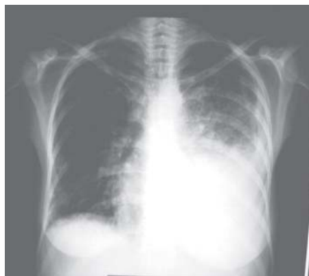
Figura 2. Radiografia de tórax com infiltrado alveolar "em vidro fosco" em todo pulmão esquerdo e derrame pleural à ipsilateral com colapso parcial do lobo inferior

A avaliação dermatológica levou à hipótese de síndrome de Sweet, confirmada pela histologia cutânea, a qual mostrou densa infiltração neutrofílica da derme (Figura 3). Dessa