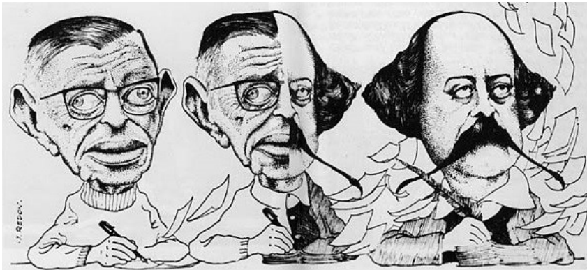
Figura 1 – Caricatura de Sartre escrevendo seu Flaubert – Desenho de J. Redon publicado no Figaro littéraire , 7 de maio de 1971. Arquivos Gallimard.

Tal investimento alicerça o enorme projeto (auto)biográfico de Sartre, na medida em que a elaboração de biografias de escritores constitui parte ponderável de sua fecunda produção intelectual, como o filósofo afirma em carta enviada ao “Castor”, Simone de Beauvoir: “Difícilmente me interesso por outra coisa senão pela vida de grandes homens. Eu quero tentar encontrar nelas uma profecia da minha” (SARTRE, 1983, p. 14), máxima explicitada na arte de J. Redon (Figura 1):