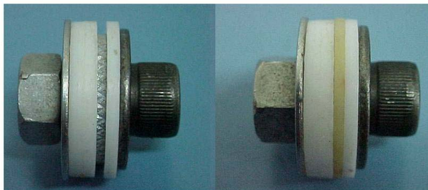
Figura 3: Matriz de teflon usada na confecção dos discos de resina.

Para facilitar e melhorar o recobrimento do disco com resina foi realizada uma matriz constituída por um parafuso central, duas arruelas metálicas, e duas arruelas lisas de teflon confeccionado com o diâmetro interno igual ao do parafuso e diâmetro externo de 26 mm (figura 3). Após o encaixe do disco na matriz foi feita a aplicação da resina sobre o mesmo com o auxílio de espátulas odontológicas, seguida de imediata polimerização de uma fina camada na superfície recartilhada, em uma extensão de 8 mm (correspondente à largura da ponta do aparelho fotopolimerizador), a qual representa cerca de 1/9 do perímetro circular da matriz.