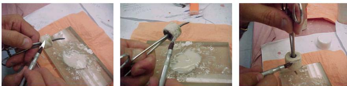
Figura 1: Aplicação da porcelana na preparação do disco dinâmico.

Após a aplicação de cada camada da porcelana (conforme mostra a figura 1) o disco foi levado ao forno para a queima. O tempo de espera para o resfriamento da peça foi de aproximadamente uma hora e meia, para que só então uma nova camada pudesse ser aplicada. Esta operação foi repetida até que o disco ficasse com um diâmetro maior do que 26 mm, necessário para a posterior usinagem (retificação).