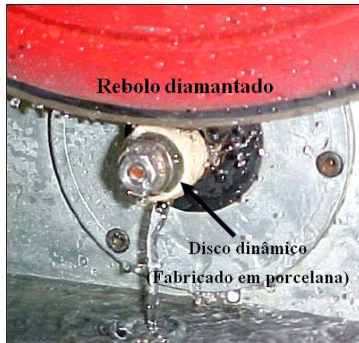
Figura 2: Detalhe da retificação do disco de porcelana. Água foi usada para a refrigeração do processo.

Na retificação a velocidade de corte empregada no rebolo foi de 33 m/s e a rotação foram aferidas com o emprego de um tacômetro manual.